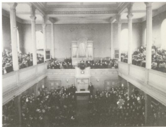
Interiörbild av Andreaskyrkan från mitten av 1890-talet. Då kallad Södra Missionshuset

När Stockholm växte under 1900-talet, knoppades delar av församlingen av till nya församlingar och kyrkor söderut.