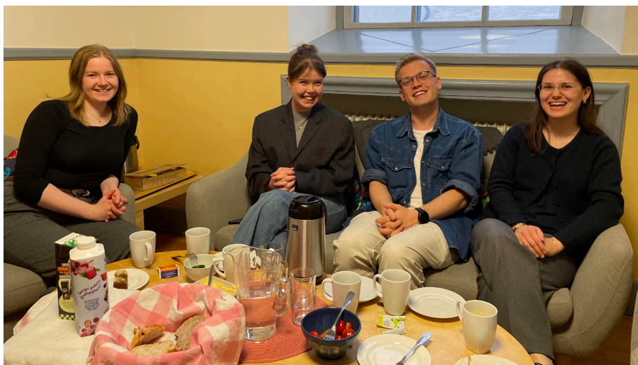
Först fika. Sedan samtal över ett intressant ämne i gruppen Tala tro.