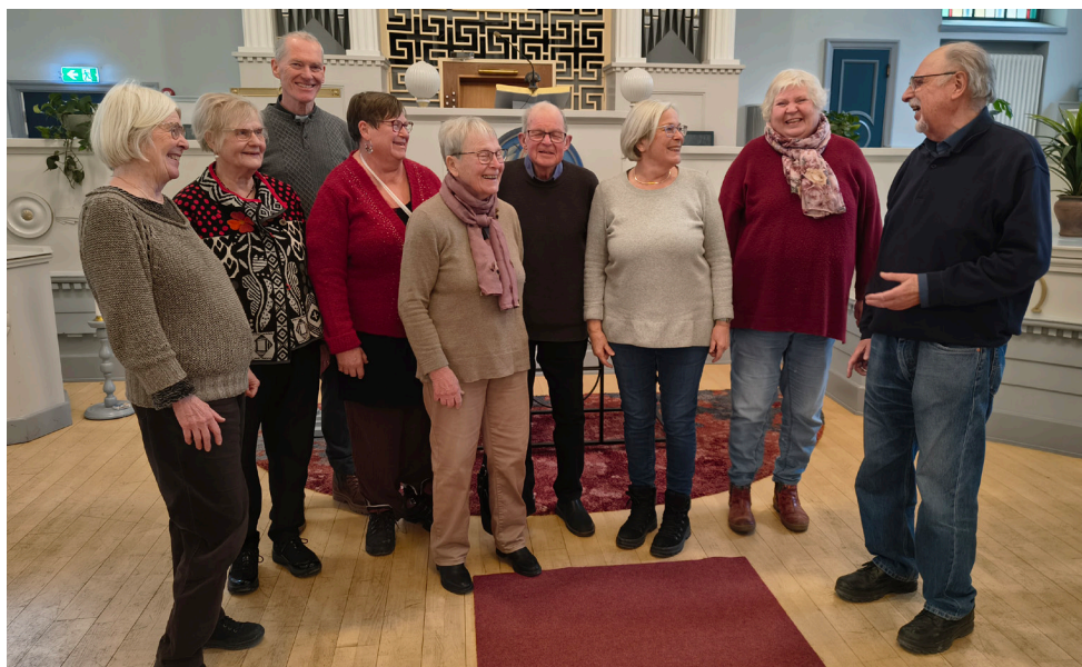
Ett glatt gäng som möts för att dela minnen och erfarenheter från Andreaskyrkans långa historia.

Utan medlemskort. Utan redovisning av tro eller uppfattning. Och, med ytterst få undantag, utan entréavgift.