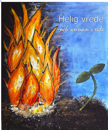
Helig vrede - och annan vrede