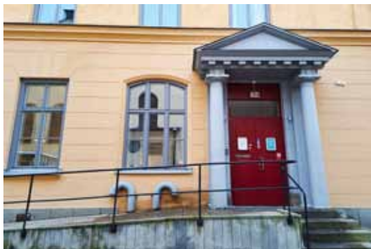
Sociala Missionen har sina lokaler på Högbergsgatan 31 A, i gårdsbuset bakom Andreaskyrkan.

- Vi vill inte bara hjälpa enskilda människor utan också peka på systemfel. Ett exempel är bostättningslagen vars syfte är att asylsökande under två år skall kunna få stöd att etablera sig i det svenska samhället. Problemet är att i en del kommuner, framför allt i storstadsregionerna, är trycket på bostäder så stort att kommunerna vill frigöra hyresrätter till andra människor. Då kan kommunen utsätta nyanlända för påtryckningar vilket gör att utsatta människor känner sig tvingade att flytta bort från den miljö som de rotat sig i.